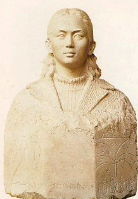
劉開渠 新しい時代を迎えて (特別出品作品)