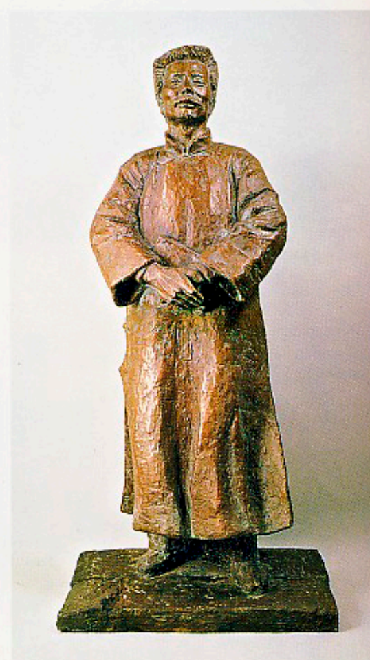
沈文強 孺子牛(魯迅像)