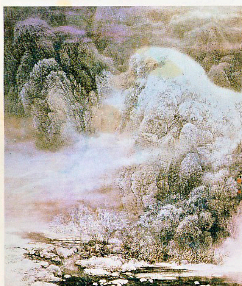
宋雨桂・馮大中 覚醒