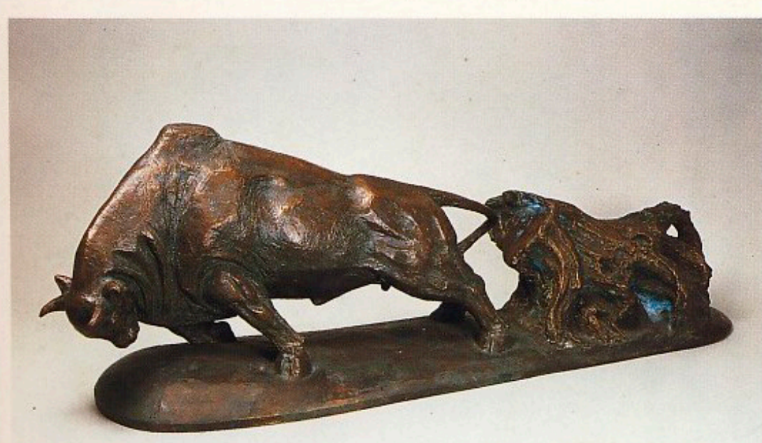
潘鶴 荒地を拓く牛

この展覧会は、日中友好会館と中国日本友好協会が主催し、外務省、文化庁、国際交流基金、日中友好議員連盟、日本中国友好協会、日本国際貿易促進協会、日本中国文化交流協会が後援している。