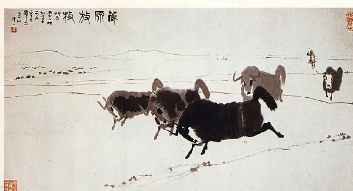
吳作人 チベット高原の放牧 (特別出品作品)

飯田橋はJR線(中央線、総武線)や、地下鉄(東西線、有楽町線)それにいくつかのバス路線が走り、駅前にも新しいビルが建ち、その広場を利用して、種々の企画や催しが行なわれ、若者が徐々に戻ってきており、新しい賑わいを呈している。